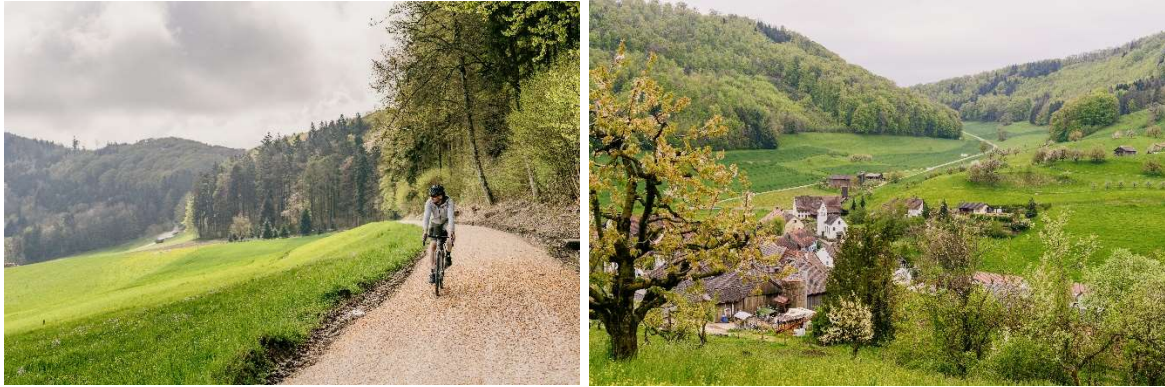
Impressionen von der Erstbefahrung: Gansingen, Routenschilder bei Oberflachs, Weg bei Thalheim und Blick auf Ittenthal