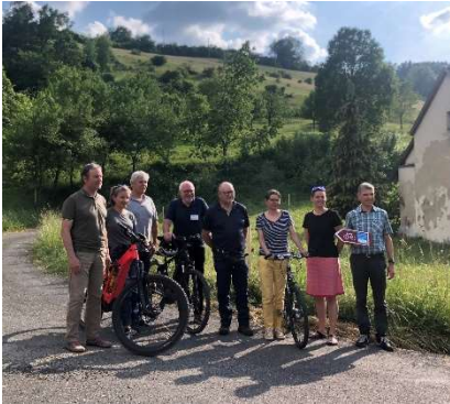
Endlich eröffnet – die Velolandroute ist durch die Hilfe zahlreicher Akteure entstanden.