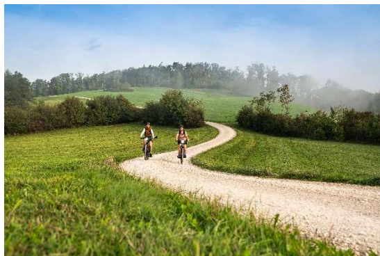
Keyvisuals Velolandroute «Jurapark Aargau»: Ausblick von der Saalhöhe und Feldweg bei Effingen